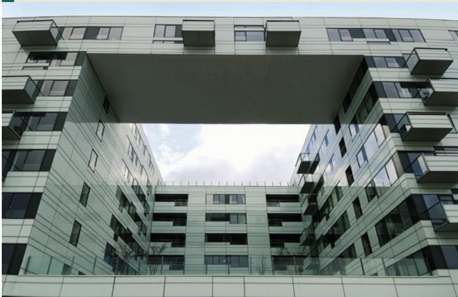
Samvirkende Boligselskaber og Boligforeningen 3B, afd. Brohuset.

og miljøfremme (udearealer, indgangspartier, beboerhuse m.v.) opnår efter loven lavere beboerbetaling end gennemsnittet, mens forbedringselementet ansættes til en højere beboerbetaling. I særlige tilfælde kan fastlægges en lavere beboerbetaling, men samlet skal beboerbetalingen i gennemsnit i udgangspunktet for hvert års tilsagn udgøre mindst 3,4 % af anskaffelsessummen. Mindst 1/3 af de støttede investeringer, godt 800 mio. kr., indeholder energibesparende foranstaltninger i forbindelse med klimaskærmarbejder (tag, facade, vinduer m.v.), vvs-arbejder m.m. Der skønnes i flere sager interesse for en supplerende støtteordning vedrørende videregående energiarbejder, hvis der er overordnet mulighed herfor.