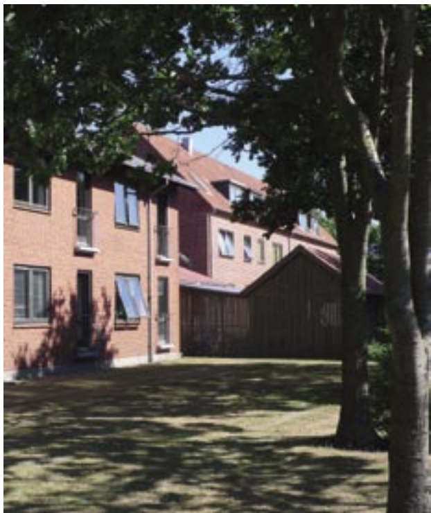
Skjern Boligselskab af 1945, afd. 81, Østergade/Fredensgade/Østre Allé.

Under alle omstændigheder er lysindfaldet en væsentlig kvalitet i boligen og de valgte løsninger skal overvejes nøje og eventuelt afprøves ved udførelse af en prøve i 1:1 – en såkaldt "Mock-up" inden der træffes et endeligt valg af tekniske og arkitektoniske løsninger.