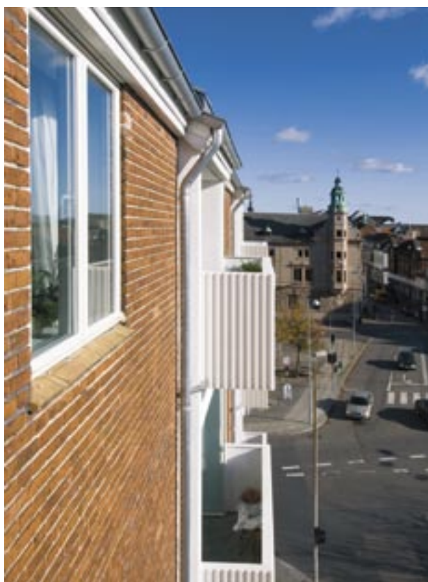
Andelsboligforeningen Beringsgaard, afd. Beringsgaard.

Der er indgået en samarbejdsaftale mellem Byggeskadefonden og Landsbyggefondens sekretariat. Landsbyggefondens sekretariat forestår placeringen af Byggeskadefondens midler, bogføring og regnskabsafklæggelse m.v. Byggeskadefondens juridiske afdeling yder Landsbyggefondens assistance i juridiske spørgsmål. Landsbyggefondens direktion indgår som del af direktionen for Byggeskadefonden.