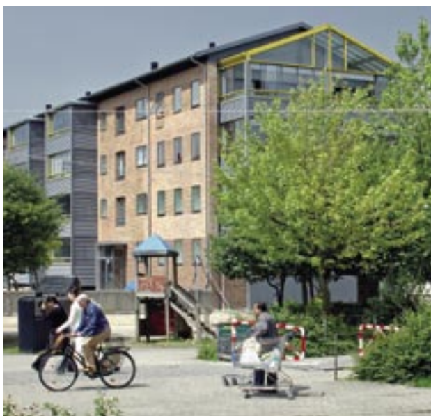
Arbejdernes Andels-Boligforening, København, afd. 55, Vejleåparken.

gives. Sagsbehandlingen følger de principielle retningslinier for denne sagstype, som fondens bestyrelse har tiltrådt.