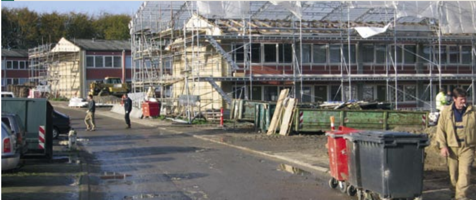
Andelsboligforeningen Himmerland, afd. 14, Golfparken.