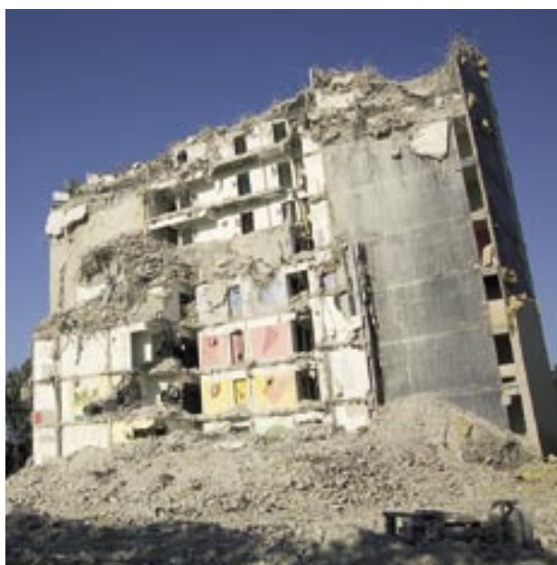
Ungdomsbo, afd. 5, Granparken/Kridthuset.

I en række sager, hvor boligafdelingerne har haft et vedvarende fald i udlejningen har det været nødvendigt at tilpasse udbuddet af almene boliger ved nedrivning. Dertil kommer reduktioner af boligantallet ved ombygninger og sammenlægninger. Disse afdelinger står ofte samtidigt overfor en betydelig renoveringsindsats for at udbedre byggeskader, udføre miljøforbedringer, forbedre konkurrenceevnen m.v. Ud fra en helhedsvurdering af bygningernes tilstand, den boligsociale situation og den fremtidige drift af afdelingerne har det i flere tilfælde været hensigtsmæssigt at nedrive en del af boligerne i de berørte afdelinger.