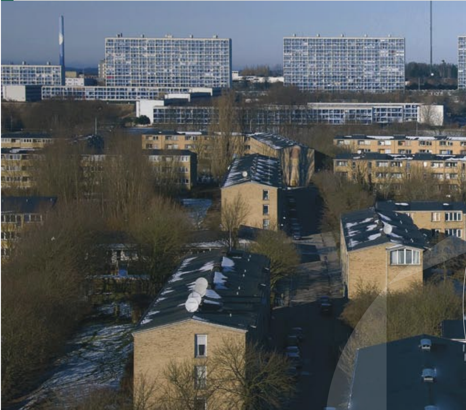
FSB-Bolig og SAB: Tingbjerg og Høje Gladsaxe i baggrunden.