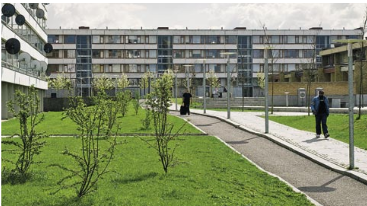
Boligforeningen Højstrup, afd.14, Egeparken.

Der har nu vist sig problemer med resterende facader og gavle. Badeværelser har problemer med utætheder og tærede rør. Der skal derfor udføres efterisolering inklusive nye indgangsfacader, vinduer og gavle. Badeværelser skal renoveres. I forbindelse med de samlede arbejder indrettes en blok til seniorboliger med elevatoradgang. Indsatsen skal sikre at Vapnagård også i fremtiden vil være en attraktiv bebyggelse i Helsingør.