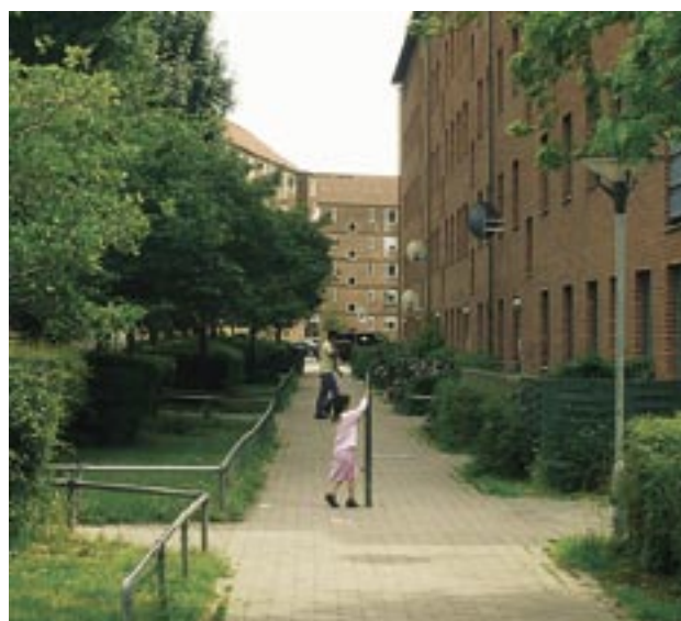
Vibo, afd. 140, Televænget II og III.

For at kvalificere indsatsen er perioden frem mod fristen for indsendelse af de endelige helhedsplaner mv. blevet anvendt på besigtigelser, forhandlinger af omfang, indhold og organisering i en række projekter, ligesom fonden i flere tilfælde har presset på for at få gennemført en lokal koordinering ved oprettelse af områdesekretariater. Disse drøftelser har medført, at der i nogle områder har skullet ske en grundlæggende revidering af projektgrundlagene. Fraregnet enkelte ansøgere, som har fået fristforlængelse, har fonden ved årets udgang modtaget de endelige helhedsplaner og projektbeskrivelser og sagsbehandlingen frem mod de endelige tilsagn pågår.