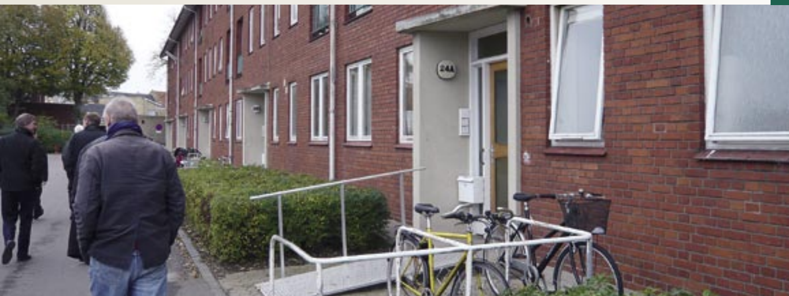
Boligselskabet Sjælland, afd. 301, Margrethegården.