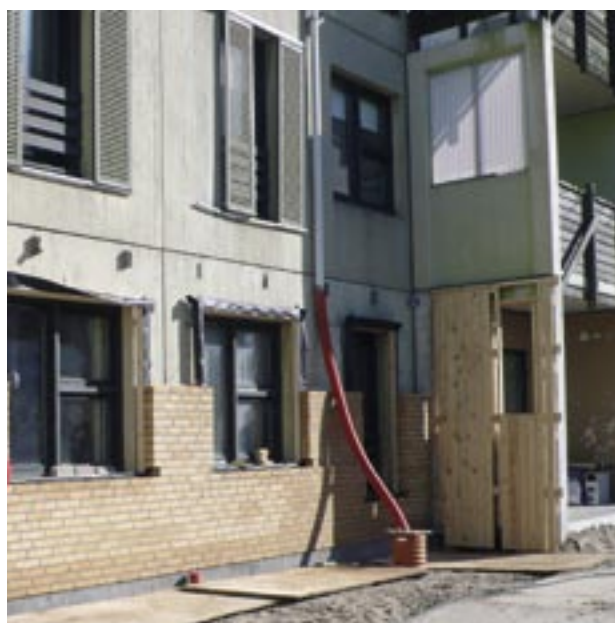
Danske Funktionærers Boligselskab, afd. Charlottetgården.

På baggrund af det beregnede behov har Landsbyggefonden udarbejdet en prioriteret liste over afdelinger, som indstilles omprioriteret m.v. helt eller delvist inden for den givne ramme på en årlig lettelse på 220 mio. kr. Listen omfatter dermed også de afdelinger, der ydes huslejebidrag til.