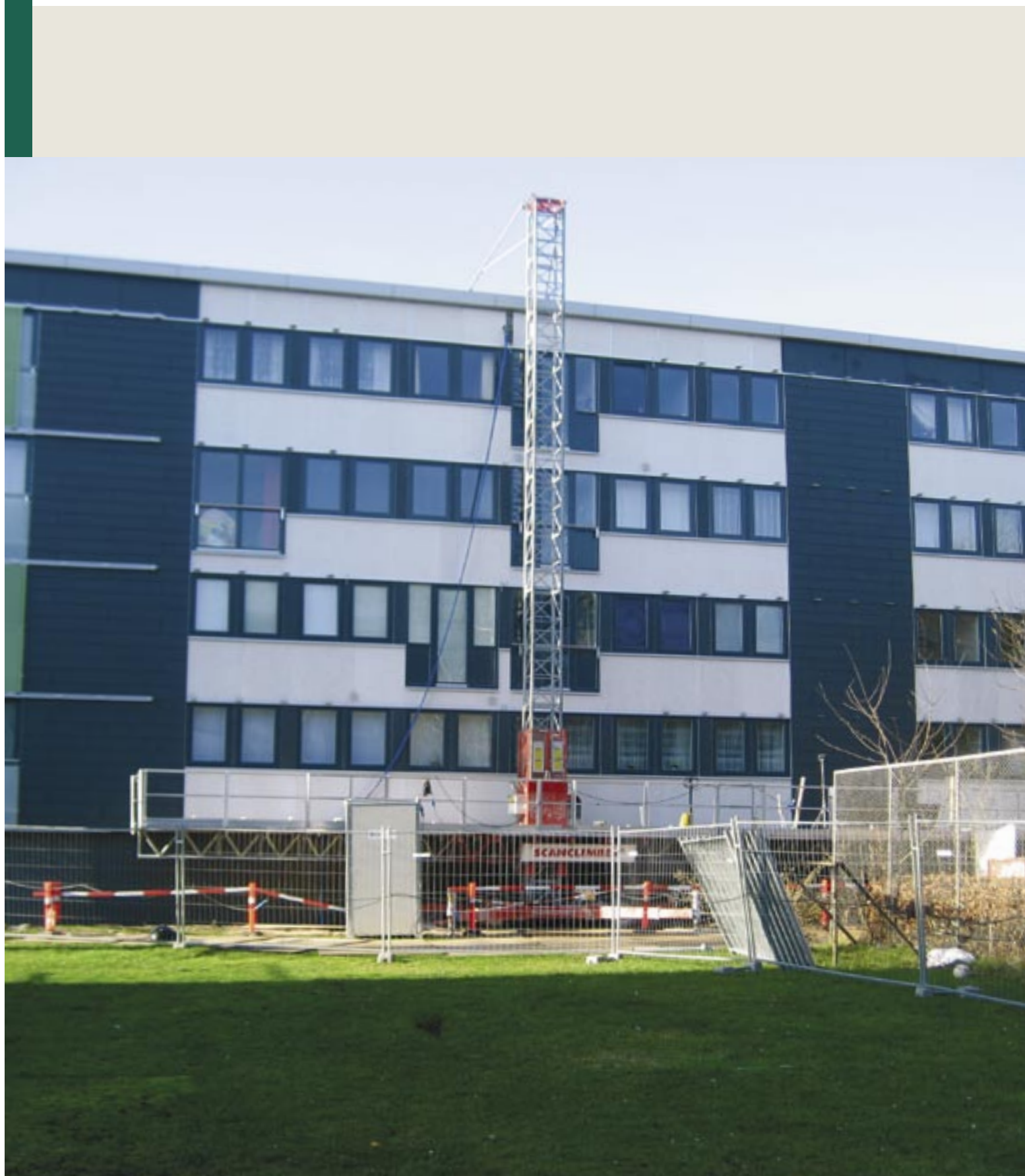
Boligforeningen 3B, afd. Remisevænget Øst.