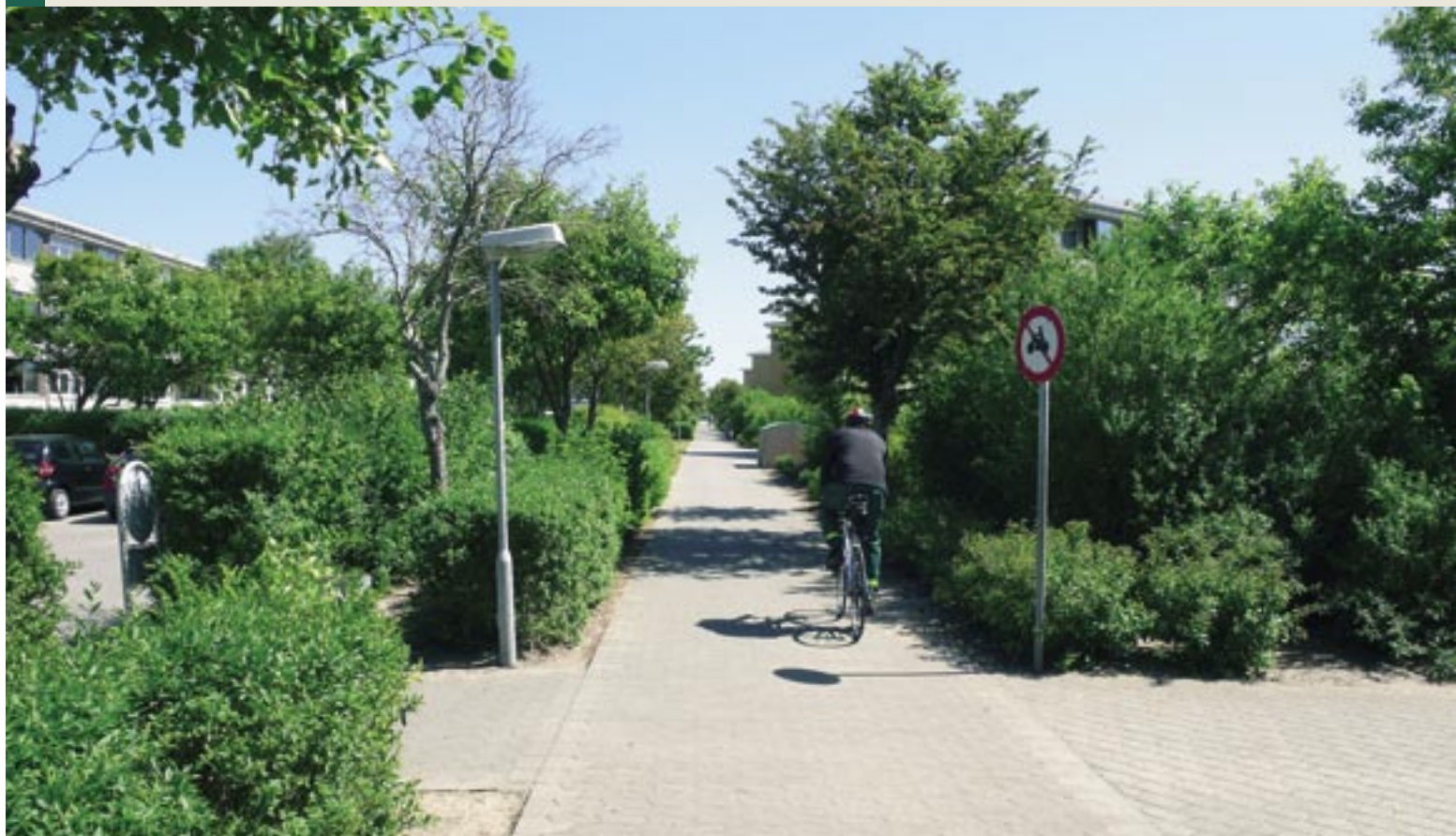
Ringkøbing Boligforening, afd. 5 og 8, Damtoften.

ring af boliger og indbygning af elevatorer, hvorved et stort antal boliger bliver egnede for ældre og handicappede. For hele boligområdet gennemføres der omfattende miljøforbedringer af udearealer m.v.