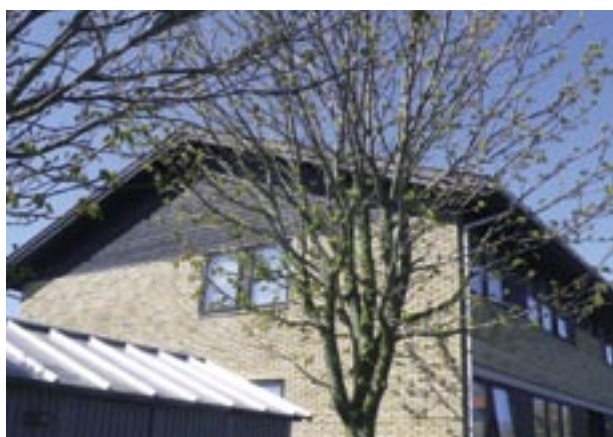
Andelsboligforeningen Eskemosepark, afd. Eskemosepark.

De samlede anlægsinvesteringer fordelt på 49 tilsagn udgjorde i 2008 på skema A-niveau ca. 2.480.492 t. kr., hvilket svarer til lovens investeringsramme. Heraf udgør investeringer i tilgængelighed ca. 166.344 t.kr. Der reguleres ikke for senere skema B og C-ændringer. Tilsagn i 2008 til de 49 sager vedrører ca. 9.206 boliger.